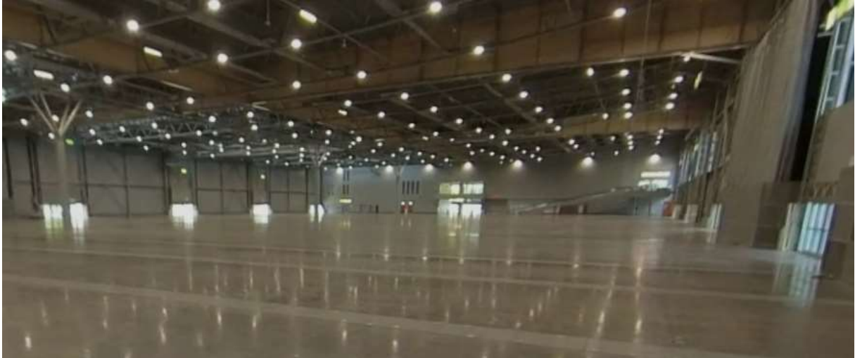
Ukázka 3D Hala P, BVV Brno, 360° indoor/outdoor snímkování ("Street View")

Součástí nabídky je fyzické zaměření speciálním laserskenem, který obsahuje vysoce přesnou GPS, 360° kameru, 2 rotační vysokofrekvenční lasery s pulsem 2 x 300.000 bodů za vteřinu, dále pak speciální SLAM (Simultaneous Localization and Mapping) technologii pro měření 3D v indoor.