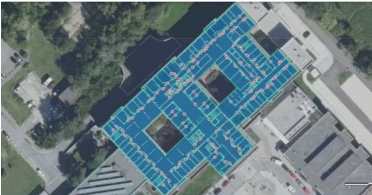
Ukázka plánu podlaží