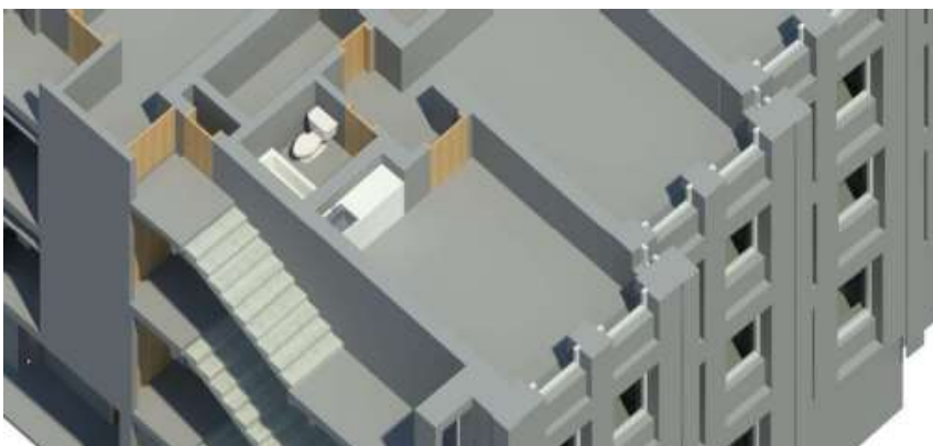
Detail LOD 200