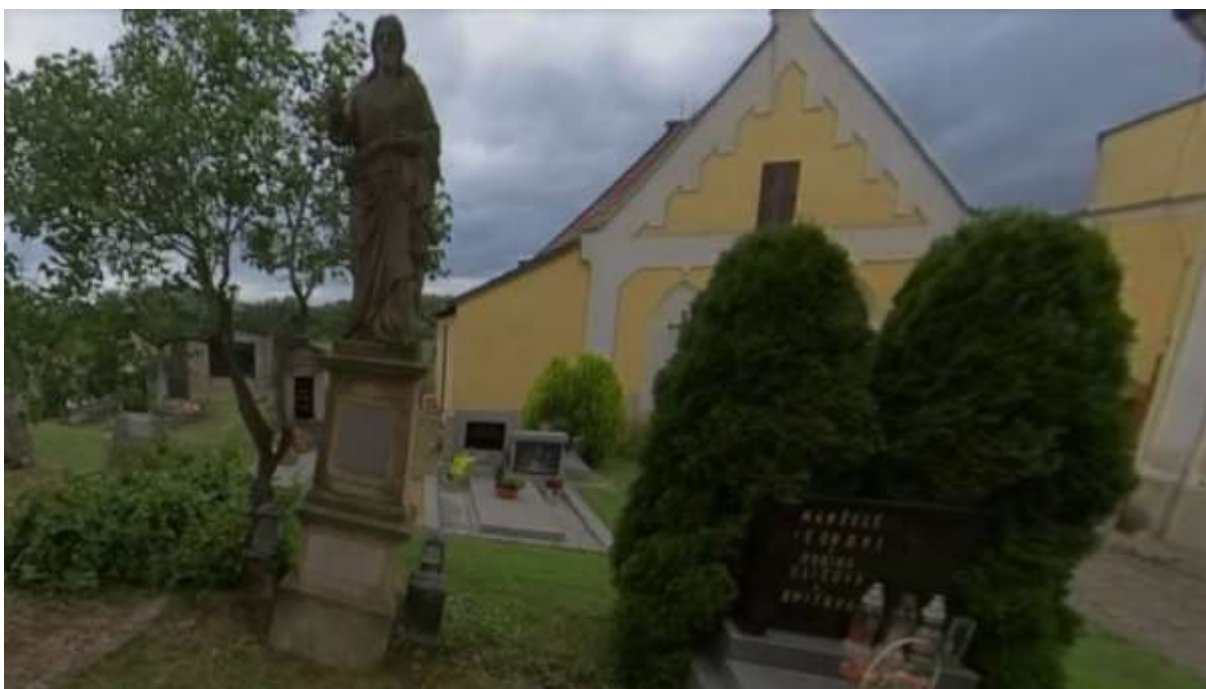
Ukázka 3D Hřbitov Budyně nad Ohří, 360° outdoor snímkování ("Street View")