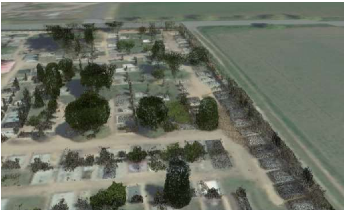
Ukázka indoor/outdoor obarveného a georeferencovaného laserskenového mračna, Hřbitov Budyně nad Ohří