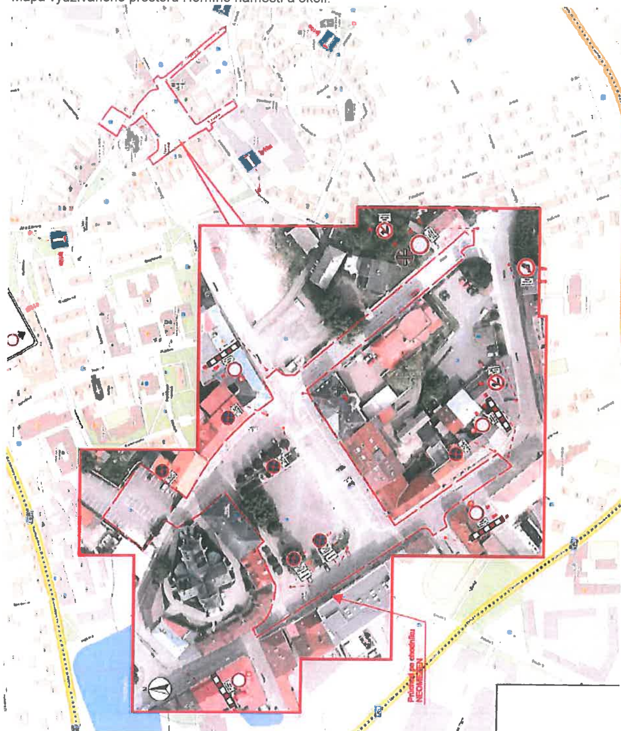
Mapa využívaného prostoru Horního náměstí a okolí.