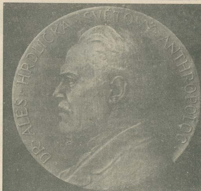
Pamětní medaile dr. A. Hrdličky (zast. um. M. Knobloch).