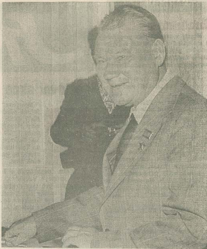
Akademik A. P. Okladnikov při přijetí hostů II. Hrdličkovy kongresu na radnici MěstNV v Humpolci.