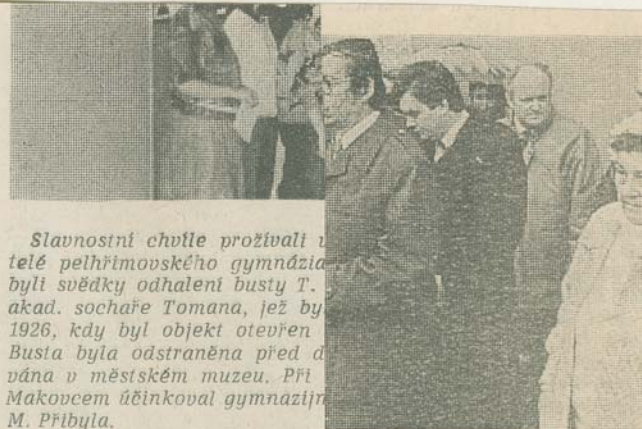
Slavnostní chvíle prožívali učitelé pelhřimovského gymnázia. Byli svědky odhalení busty T. G. Masaryka, sochaře Tomana, jež byl v roce 1926, kdy byl objekt otevřen. Busta byla odstraněna před dvaceti lety v městském muzeu. Při odhalení účinkoval gymnazijní sbor. M. Přibyla.

hářdup č. 11, roč. 40, 4 15. 3. 1990 E. 11 15/3