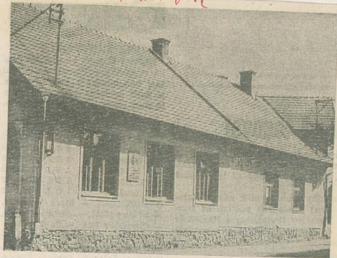
Rodný domek Gustava Mahlera v Kalištích u Humpolce, čp. 9.